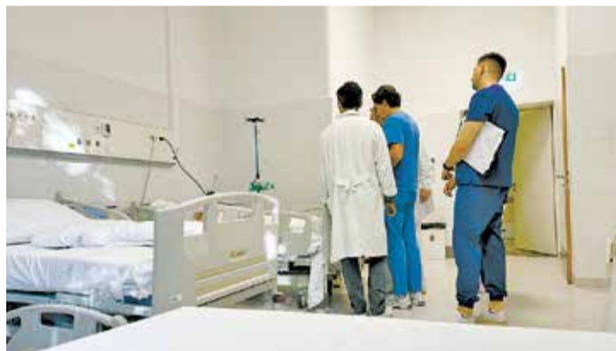
Konzílium – alulnézetben

HOGY VELEM ez történt, az lehet egyéni adottság, de hogy bárki bármikor kerülhet ilyen helyzetbe, arra álljon itt a szobatársak némelyikének története. Egyiküknek az volt a vétké, hogy jóízűen elfogyasztott egy szelet rántott pontyot. Valószínűleg annak egyik szálkáját nem vette észre, és az a szálka, odabent kolbászolva úgy döntött, hogy