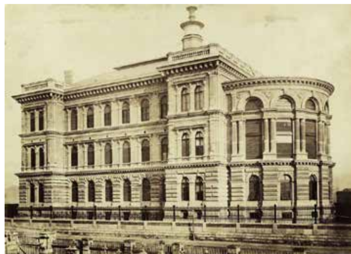
A Sebészeti klinika épülete a századelőn