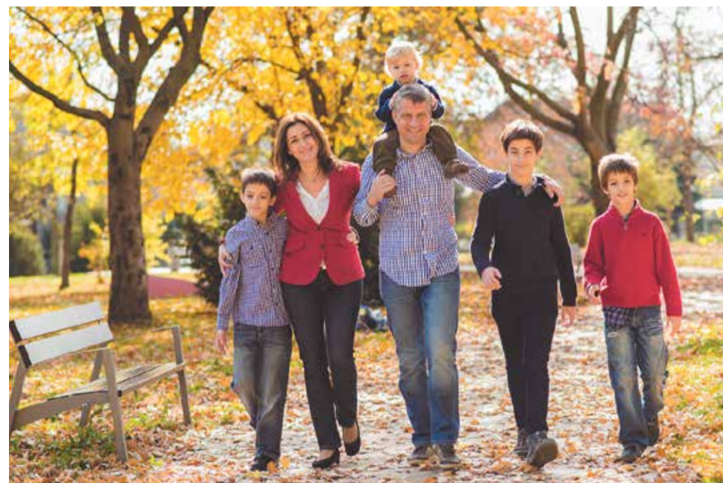
Családi kép 2014-ből

otthon sosem erőltettk a politikát, a politikával való foglalkozást.