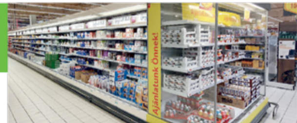
A húsz éves, műszakilag elavult hűtők helyett...

Az öt hónapos átépítés alatt az áruház teljes alapterületének csupán 5-8 százaléka lesz lezárva. A lezárt terület kínálatát arra az időre máshová helyezik, és erről tablókron tájékoztatják majd a vásárlókat is. Az áruház dolgozóit rendszeresen felkészítik, hogy a hozzájuk forduló vevőknek megfelelő tájékoztatást tudjanak adni, milyen terméket hol találhatnak meg.