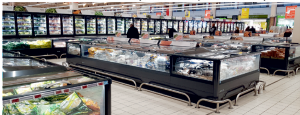
Az alacsony fagyasztók beláthatóvá teszik a tereket