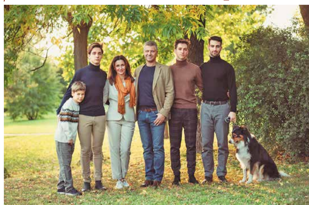
Családi kép 2021-ből – a fiúk jó nagyot nőttek