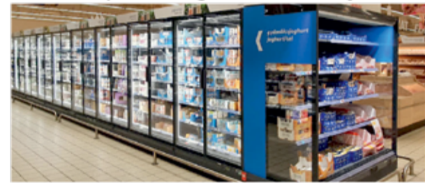
...új és korszerű hűtőpultba kerülnek a tejtermékek