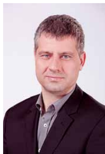
Szatmáry Kristóf államtitkár, parlamenti képviselő

Fontos kiemelni, hogy amennyiben a szolgáltatók nem hajtják végre a díjak mérséklését, és erről az egyes számlázási időszakra vonatkozó számlán nem adnak egyértelmű, írásos tájékoztatást, ak-