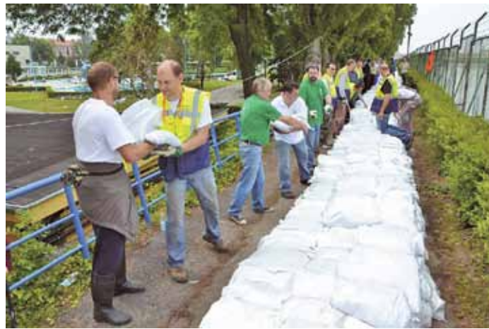
Homokzsák-pakolás a Dagály strandnál, ahol nagyon meggyengült a védelmi vonal