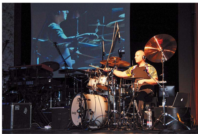
Az est sztárdobosa, Borlai Gergő, aki húsz éve meghatározó alakja a hazai és nemzetközi zenei életnek – az egyetlen magyar a világ 500 legjobb dobosa között