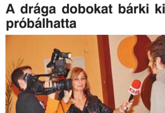
Munka közben a Rákosmente TV stábja