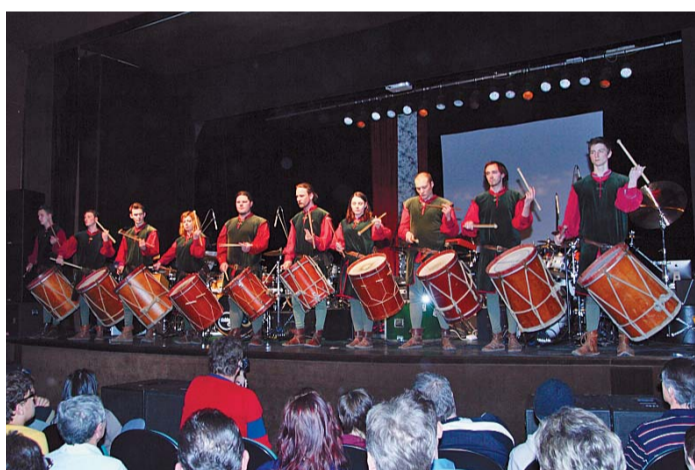
A visegrádi királyi dobosok köszöntötték a rendezvényt