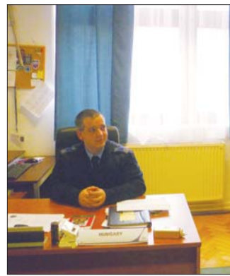
megbízottak egyik fontos feladata lesz az „Iskola rendőre” programban való

A „KMB”-seket idővel közvetlen mobilszámon lehet majd elérni, és minden városrésznek külön körzeti megbízottja van. A körzeti