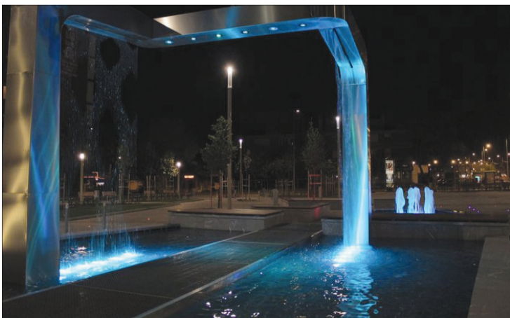
Horváth Péter felvételén a vízfáték esti díszkivilágításban pompázik