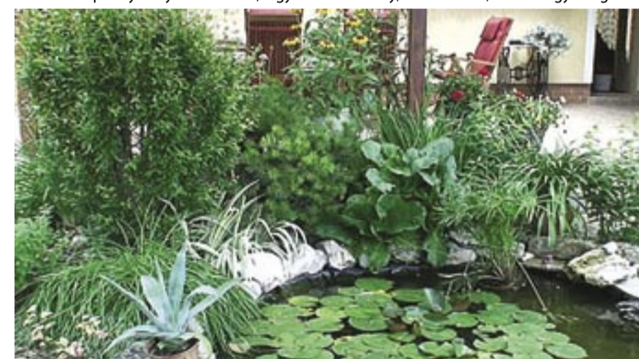
Családi ház kertje, I. helyezett - Strázsashegy utca Ház és kert kapcsolata dícséretes, növényválaszték és -elhelyezés kifogástalan, a kert intim, de otthonos.