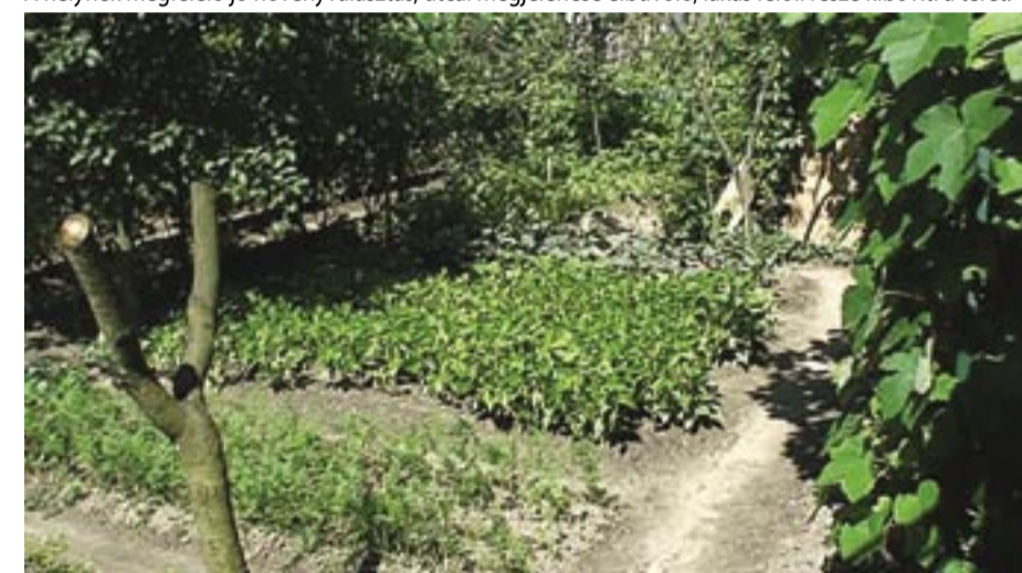
Gazdasági udvar, I. helyezett - 513. utca Minden talpaltnyi hely kihasználva, legyen az főnövény, másodvetés, szőlő- vagy virág