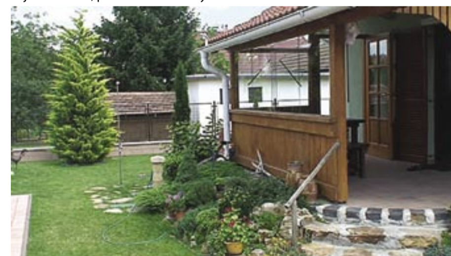
Családi ház kert, különdíj - Jászdózsa utca Kis területen nagy térhatás, a jó növényválasztéknak köszönhetően.