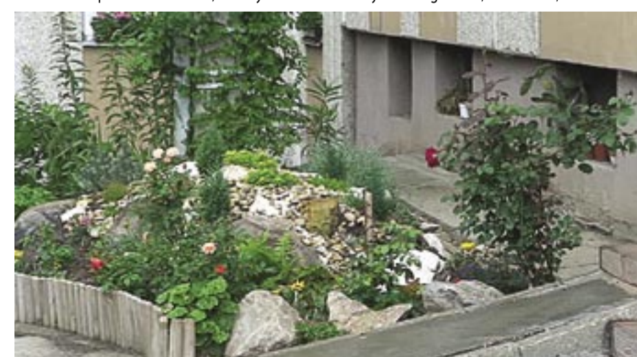
Lakótelepi előkert, II. helyezett - Földműves utca A társasház előkertje példaértékű, fejlődése évről-évre számottevő