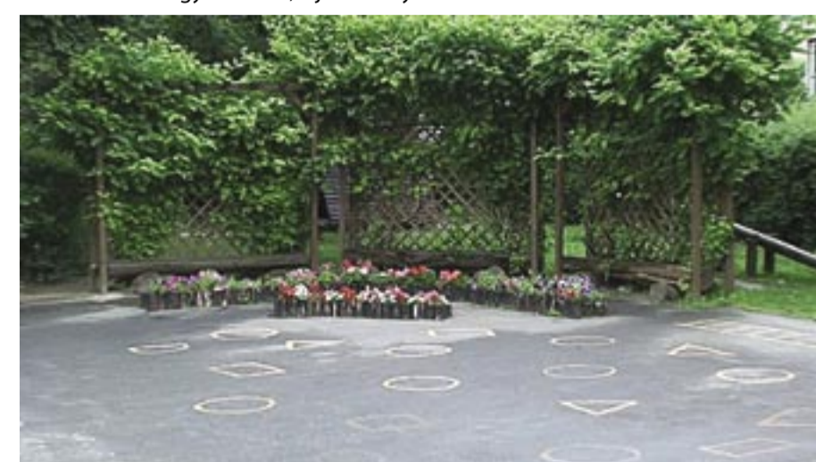
Intézményudvar, I. helyezett - Napsugár óvoda Az óvoda kapuján mindig jó érzés belépni, az ápoltság, a virágok megválasztása igen jellemző