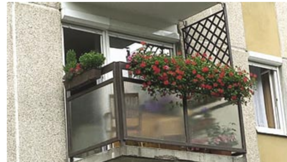
Lakótelepi erkély, I. helyezett - Akácvirág utca A helynek megfelelő jó növényválasztás, utcai megjelenése elbűvölő, lakás felőli része kibővíti a teret.

A verseny mottója: „Az emberi nemnek hivatása nem rontás, pusztítás, megsemmisítés, hanem, hogy munkáljon, alkosson, teremtsen.” (Széchenyi István: Por és sár)