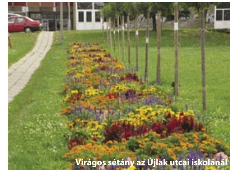
Virágos sétány az Újlak utcai iskolánál