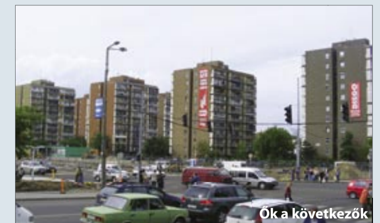
Ök a következők

ható panelházak komolyabb forrásokat nyerhetnek az előkertek esztétikus kialakítására.