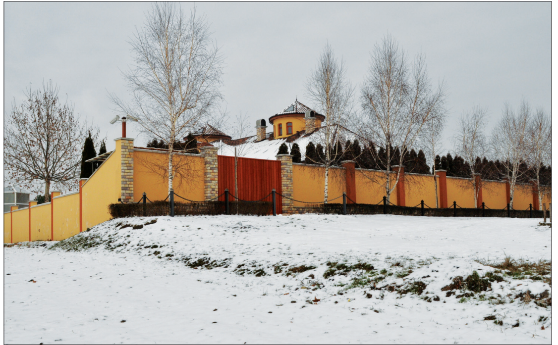
Korábban út, most kerítés kamerával

A Budapesti 1. számú Körzeti Földhivatal a tulajdonjog fenntartással történt eladás bejegyzését elutasította. A Seychelle-szigetek még várhat.