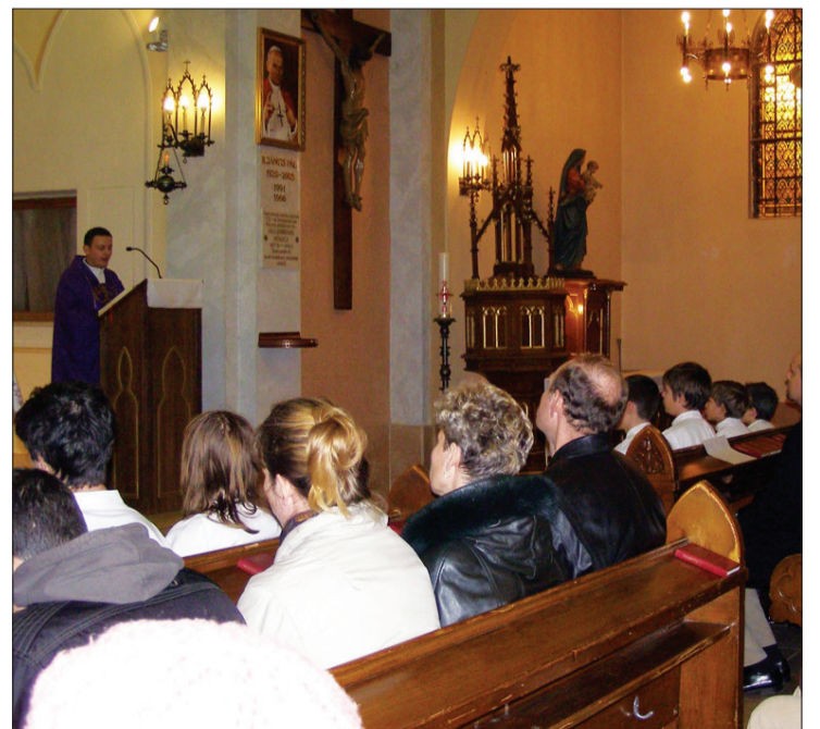
Szentmisén emlékeztek az öt évvel ezelőtti történetekre

Ezzel a szórólappal kampányoltak a kettős állampolgárság ellen