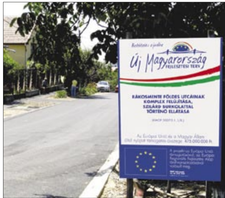
EU-s pénzből is épültek utak