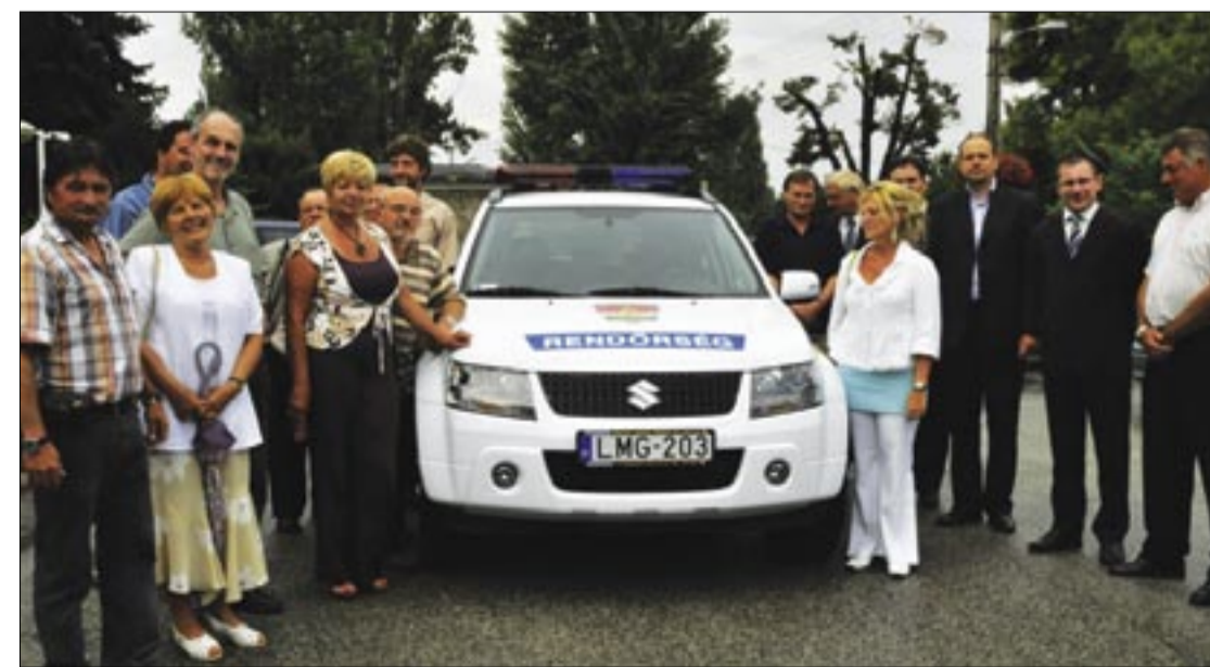
Az Önkormányzat új terepjárót vett a rendőrségnek