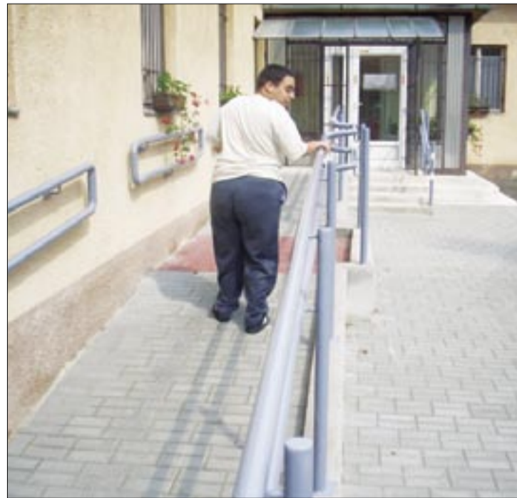
Akadálymentes Móra Iskola...