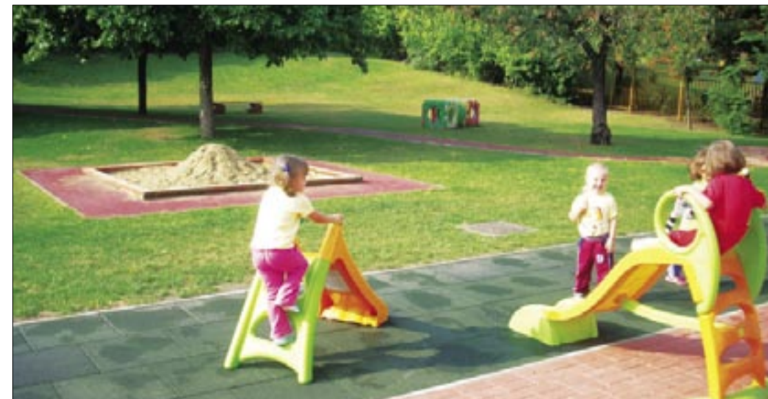
Új játszódudvar a Csibe Bölcsődében