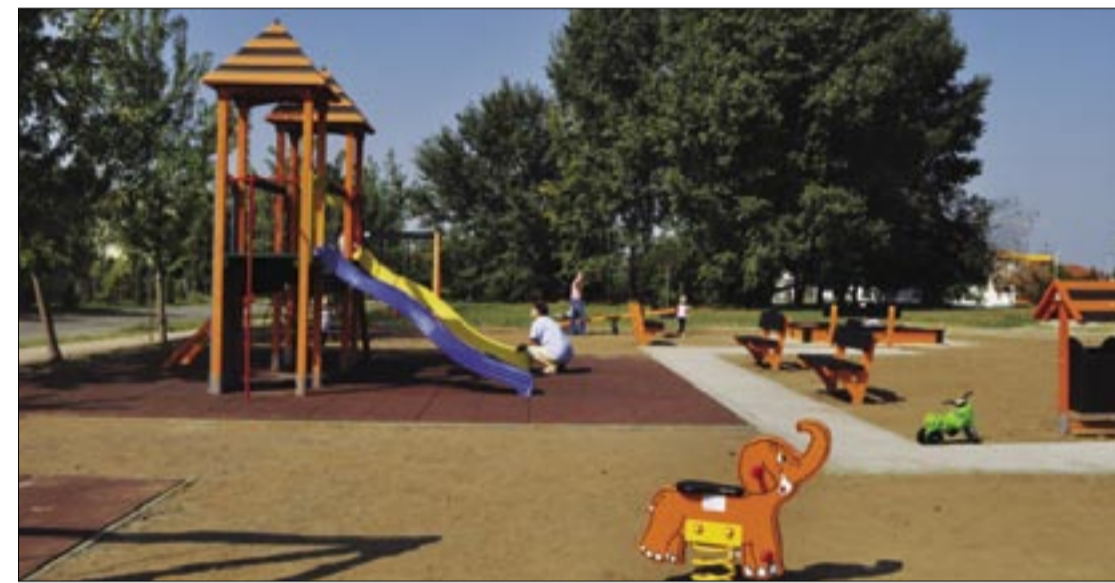
Elkészült a játszótér a Pesti úti lakóparknál