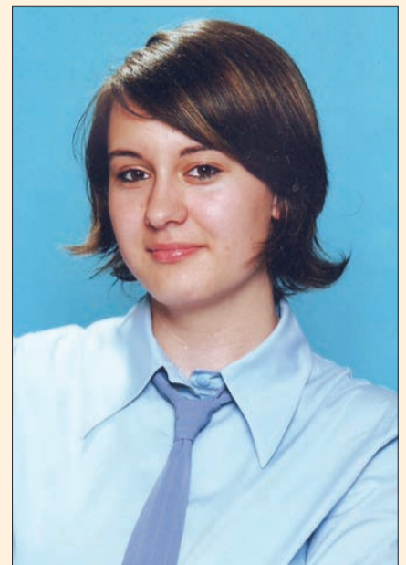
Ballagási fotó, 2006