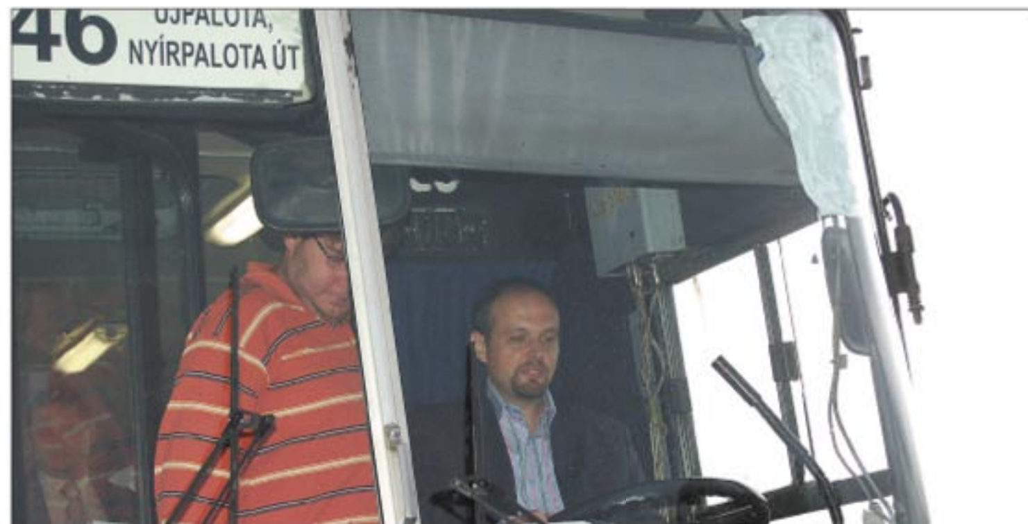
A polgármester jó irányba tekerte a kormányt