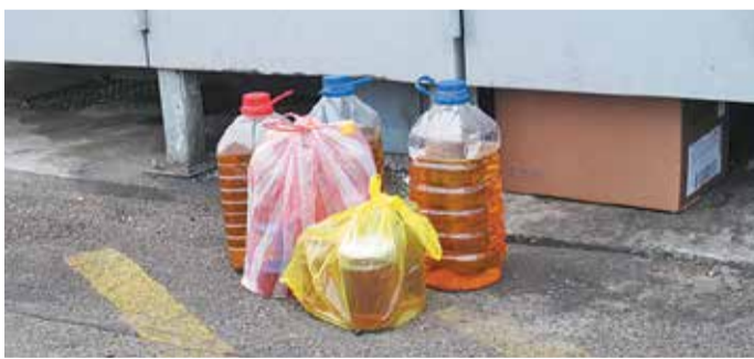
Leadott sütőolajok egy benzinkútnál

vezetnek, jellemzően kerületi óvodai alapítványoknak. A gyűjtőpontok kialakítása folyamatban van, és a járványhelyzet alakulásától függően hirdetik majd meg ezt az új és hasznos lehetőséget.