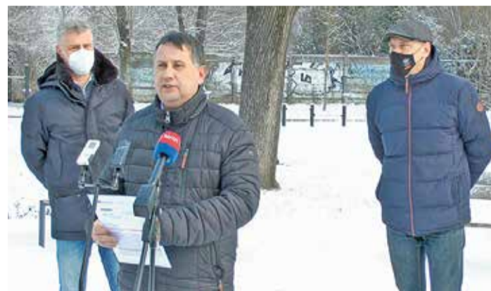
A Cinkotai strand területének tervezett átminősítésével kapcsolatos történésekről számolunk be lapunk 3. oldalán