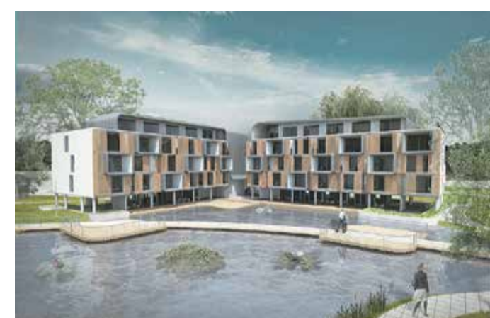
Sportszálló – a lehetséges beépítés látványterve

szálló tervei láthatóak, nagy-nagy vízfelületekkel (ami azokból a fűrt kutakból származna, amit a strand táplálására létesítettek, miután a Caprera-patak víze az alsóbb szakaszokon már jelentősen elszennyeződött).