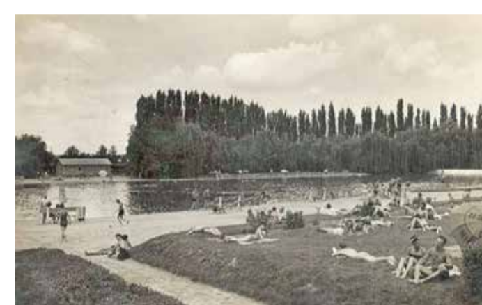
A Cinkotai strand egy régi képeslapon. A hatalmas területen ezerötszáz fürdőző is kényelmesen elfért

Az Építészúrumon fellelt képek szerint történtek bizonyos tervek a beépítésre. A képen például egy sport-