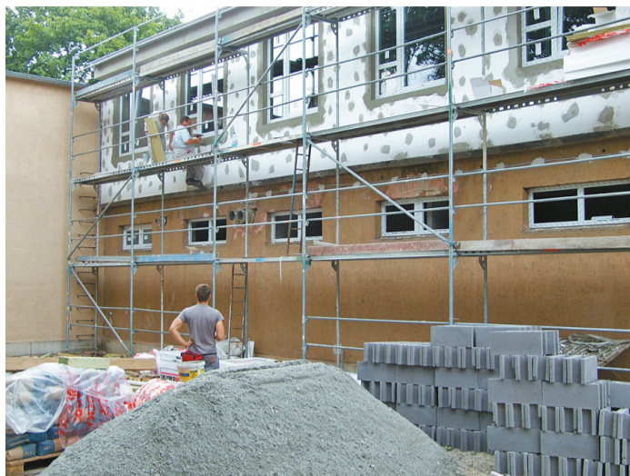
Október elejére 220 millió forintos költségből hét tantarommal bővül a Batthyány Ilona Általános Iskola

A vizesblokkokat érintő komolyabb felújítás a Centenáriumi Általános Iskolában és Szakiskolában, valamint az Arany János Általános Iskolában volt.