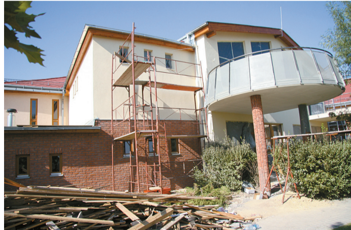
Bővül az óvodai férőhely Csömörön

– Az óvoda az egyik ilyen nagy projektünk. Korábban európai uniós pályázatból épült