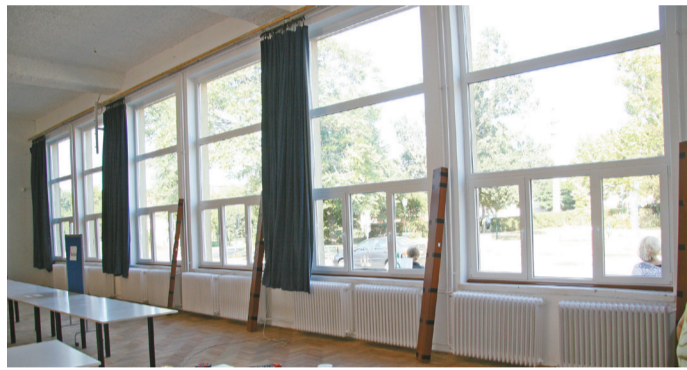
Új nyílászárók a Petőfi Sándor Művelődési Házban

– A Pataksétány mindenképpen különleges helye lesz Csömörnek.