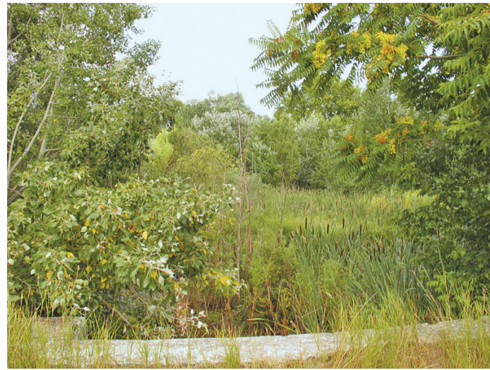
A nagymedence látványa a medence betonszegélyéről nézve: a vizes helyeken sás és buzogány virul, a kiszívóból kisebb-nagyobb fák nőnek az égbe, a medence alján békakórus zengi az LMP igazát