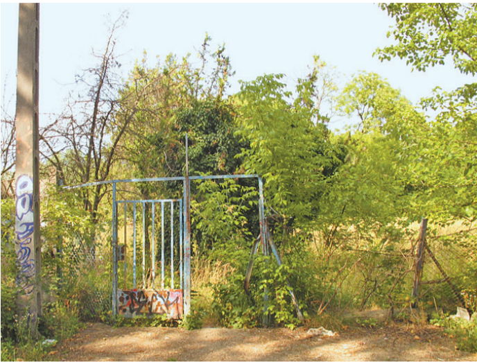
A Cinkotai strand bejárata