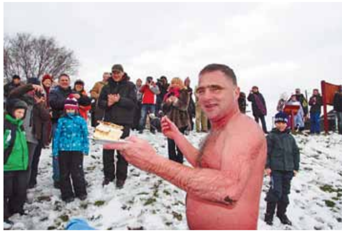
Krémes várta a Naplás-tó partján a Nemzet Rozmárját, aki vizesen, tavi moszattal a könyökén kezdett lakmározni, miközben a nézők hosszas tapssal üdvözlötték

– Ez az úszás tavaszkiöszöntő eseményként lett meghirdetve, de valójában egy télbúcsúztató úszásról volt szó – mondta