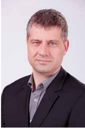
Szatmáry Kristóf államtitkár, parlamenti képviselő

– Pontosan erről van szó: ilyen adósságok mellett nem beszélhetünk független magyar gazdaságpolitikáról, és