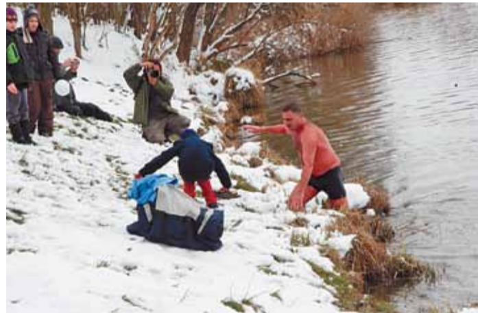
Schirilla jó tíz perc úszás után jött ki a 0,9 fokos tóból