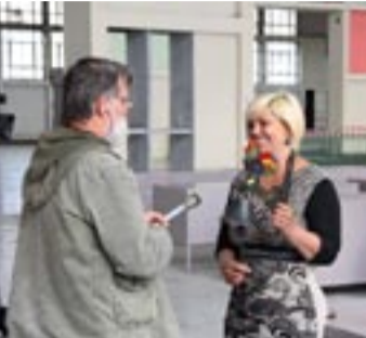
A piac üzemeltetője egy kis hang megkondításával jelezte az Ikarus piac megnyitását

a kerületben, ami szerinte nem ugyanaz a kategória. Azt a véleményét is többször nyilvánította, hogy szerinte csak a Polgármesteri Hivatal kekeckedik vele, mert félnék, hogy a konkurenciája lesz majd a sashalmi piacnak. Erre utal, hogy előzetesen minden engedélyt sikerült beszereznie, csak a hivatal pecsétje és a jegyző aláírása hiányzik még. A hivatal ezzel szemben arra hivatkozik, hogy a csak a törvények