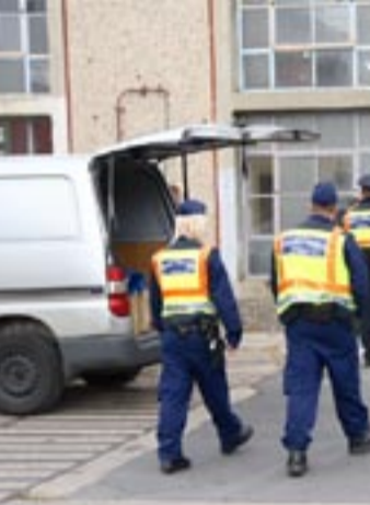
Rendőrök kíséretében érkeztek meg a hatósági személyek, akik a piaci tevékenység alapos ellenőrzésébe kezdtek

adok-kapokat követően az a néhány árus is, aki vállalta a kockázatot, elhagyta a piac területét. A működtető azonban továbbra is ragaszkodott a nyitóbulihoz, ennek megfelelően a délutáni produkciókat sem mondta le. Csak, hogy ezeket már nem tarhatta meg a csarnokban, ahol bőven lett volna hely, hisz a tömegrendezvények megtartását is szigorítja a piacot. Erről a környék lakóit szórólapon segítségével értesítette. Nagy built ígért nekik, olyan sztárokkal, mint a két Megasztár-győztes, Tóth Vera és Caramel, akik meglepő módon ígért mondták a felkérésre. A két sztár valószínűleg kevés információval rendelkezett a piac körüli viharokról, máskülönben nem vállalta volna az engedély nélküli létesítmény nyitónapságával járó kockázatot.