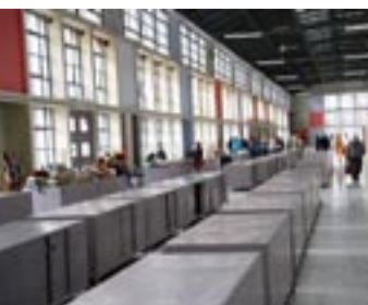
Kevés árus vállalta a kockázatot

adok-kapokat követően az a néhány árus is, aki vállalta a kockázatot, elhagyta a piac területét. A működtető azonban továbbra is ragaszkodott a nyitóbulihoz, ennek megfelelően a délutáni produkciókat sem mondta le. Csak, hogy ezeket már nem tarhatta meg a csarnokban, ahol bőven lett volna hely, hisz a tömegrendezvények megtartását is szigorítja a piacot. Erről a környék lakóit szórólapon segítségével értesítette. Nagy built ígért nekik, olyan sztárokkal, mint a két Megasztár-győztes, Tóth Vera és Caramel, akik meglepő módon ígért mondták a felkérésre. A két sztár valószínűleg kevés információval rendelkezett a piac körüli viharokról, máskülönben nem vállalta volna az engedély nélküli létesítmény nyitónapságával járó kockázatot.