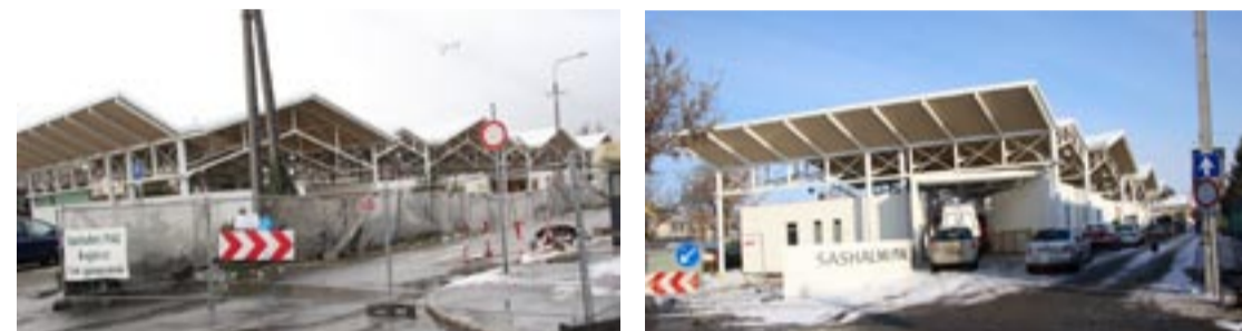
A SASHALMI PIAC – ELŐLRŐL ÉS HÁTULRÓL: a Sashalmi sétány valamint a Thököly út irányából. Az üzletek túldoldali felsorolásánál a lenti üzletszámozást is feltüntettük, így a térképen is be lehet az üzleteket azonosítani.

a forgalmat tekintve folyamatos a javulás. Az embereknek még ismerkedniük kell a régi-új környezettel. Az első két hétvége komoly bizalomra adhat okot. A legutóbbi szombaton annyian voltak a piacon, hogy egy tűt is nehéz lett