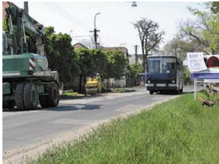
Ha csak felpályán is, de már ismét lehet használni a Csömöri utat

egészen a Párta utcáig kell menni, hogy aszfaltúton el lehessen érni a Csömöri utat (addig van néhány jókora kátyú, s egy kis kaland az éppen aszfaltozás alatt álló Jávorfá utcai kereszteződésben). Ennél sokkal jobb megoldás a Lajos utcán megközelíteni a Csömöri utat már átadott szakaszát – ez a Rákosi útról és