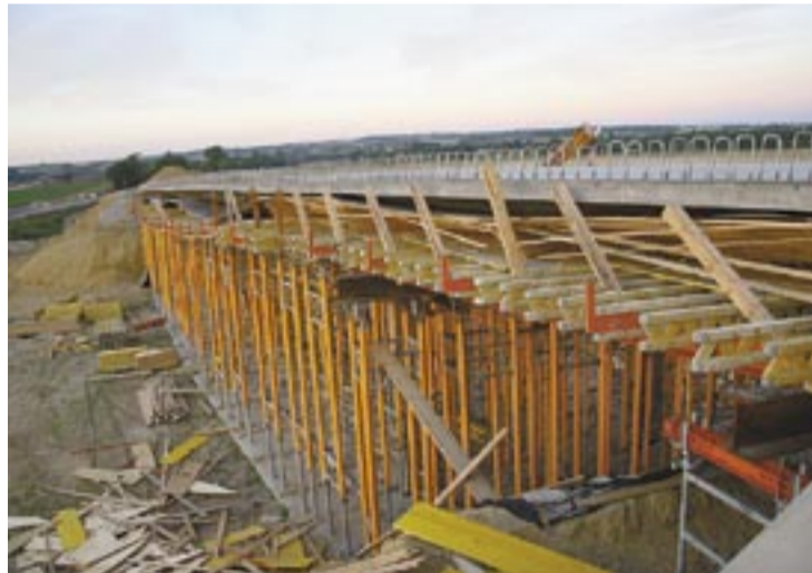
A Cinkota és Nagytarcsa közötti út felüljárója. Egy évet máris csúszik a beruházás

Az M0-ás Keleti szektorának megépítését az Európai Unió Kohéziós Alapja és a magyar állam finanszírozza 85-15% arányban. A pályázaton elnyert összeg 70 milliárd Ft értékű euró. A szektor 2x2 sávval és egy leálló sávval épül, és amennyiben ezt a forgalomnövekedés indokolja, helyenként akár 2x3 sávra is bővíthető lesz. (Tolnai)