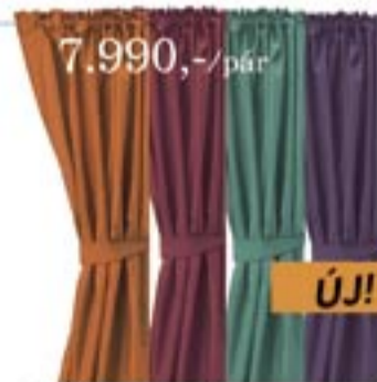
7.990,-/pár FELICIA függöny+elkötő Lila, pink, zöld-kék, sötétnarancs színben, 145x300 cm. 100% polészter. Tetején ránclószalag, mosógépben mosható.