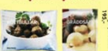
195,- Hűsgolyó szász 1 kg 1.495,-