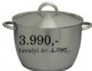
3.990,- tavalyi ár: 4.790,- IKEA 365+ fazék fedővel 5 L, rozsdamentes acél. Ø23 cm, M15 cm.