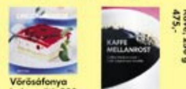
475,- Kávé 250 g