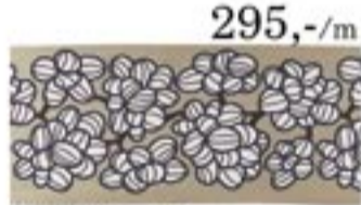
295,-/m ANNABELLA méteráru Kékesnyelű szegett szélékkel. 100% pamut. Sz45 cm. Vegyes minták.