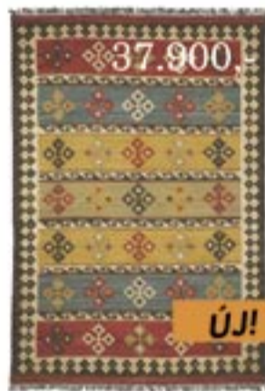
37.900,- KIBÁK szőnyeg 170x240 cm. 100% tiszta gyapjú, kézzel szőtt.