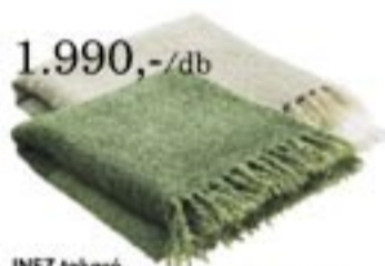
1.990,-/db INEZ takaró 130x170 cm, narancssárga, bézs, zöld színben, 63% akril, 25% polészter, 12% mohair.

Ajánlataink szeptember 4-től szeptember 17-ig – a készlet erejéig – csak az Örs vezér téri áruházunkban érvényesek.