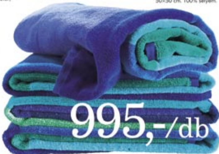
995,-/db BRUNKRISSLA törülköző 50x100 cm, 100% pamut, mosógépben mosható.