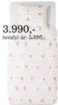
3.990,- tavalyi ár: 5.280,- ALVINE BUKETT ágyneműhuzat 150x210/50x60 cm, 100% pamut, több méretben kapható.