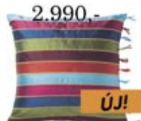
2.990,- ANDREA RAND párnahuzat 50x50 cm. 100% selyem.