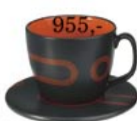
955,- SORLA teáscsésze/ajl Ködedény. Ø18 cm, M9 cm. Tálfogat: 50cl.