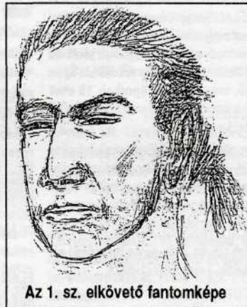
Az 1. sz. elkövető fantomképe

3. 20-22 év körüli, vékony testalkatú, rövid, barna, egyenes szálú haj. Fekete keretes szemüveget visel.